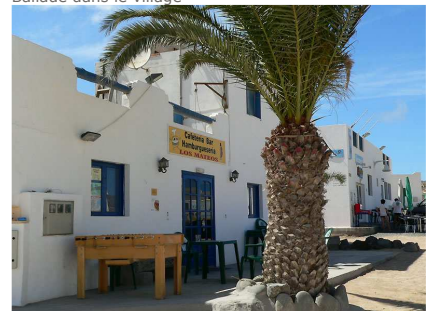
Pas foule dans la rue à l'heure de la sieste